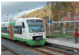
Neuer Bahnsteig in Sonneberg Ost

Die Station „Koeppelsdorf“ entstand als Haltestelle 1885/86 . Die Industriegemeinde Köppelsdorf war Hochburg der Porzellanherstellung. 1900 – nunmehr als Bahnhof bezeichnet – wurde Köppelsdorf-Oberlind Abzweigstation nach Neuhaus b. Sonneberg, ab 1901 nach Stockheim/Ofr. Der Bahnhof blieb bis 1970 Abzweigstation nach Neuhaus-Schierschnitz. Der 10. Großcontainerumschlagsplatz (GCUP) wurde 1970 nach einer Bauzeit von sieben Monaten eröffnet, war der Stolz und das Aushängeschild der DR im Landkreis. Nach der Währungsumstellung 1990 gingen die Umschlagszahlen zurück. 1998 legte der DB-Geschäftsbereich Umschlag die Anlage wegen „Nichtauslastung“ still. Proteste blieben ungehört. 2002 wurden durch die ThE die nicht mehr benötigten Bahnhofsgleise abgebaut, Güterverkehr ist weiterhin möglich. Das brachliegende Gelände ist 2005 zur Müll-Umladestation geworden.