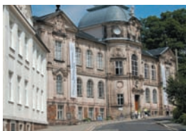
Das Deutsche Spielzeugmuseum