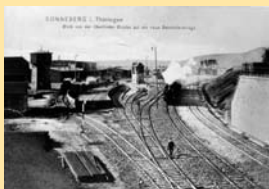
Der Ostteil des Bahnhofs 1910

1858 erhielt die damals 4.996 Einwohner zählende Stadt durch die private Werra-Eisenbahn-Gesellschaft Eisenbahnanschluss. Am 2. November fuhr der erste Zug von Eisenach nach Coburg auf der Werrahauptbahn, gleichzeitig wurde die „Zweigbahn Coburg – Sonneberg“ eingeweiht. Der Bahnhof war für 28 Jahre Endstation.