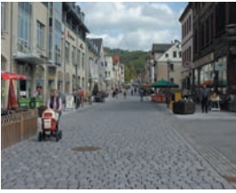
In der Bahnhofstraße