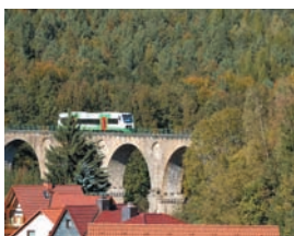
Regio-Shuttle am Viadukt in Sonneberg West

Der Haltepunkt liegt idyllisch am Waldrand des „Eichberges“ – ideal für Wanderer und Naturfreunde. Fahrkarten wurden bis 1967 verkauft. Der Bahnsteig wurde 2002 erneuert.