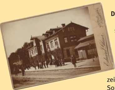
Alter Bahnhof vor 1890