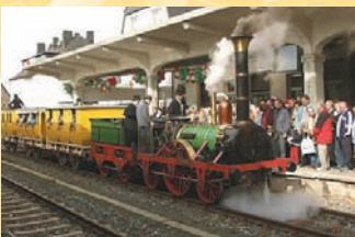
Der Nachbau des legendären „Adler“ beim Bahnhofsfest zum 7. Thüringentag am 5. Oktober 2002