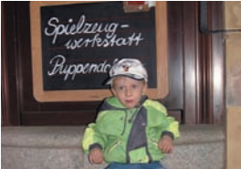
Vor der Praxis Puppendorf