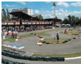
Beim Wettkampf an der Rennstrecke von Dickie