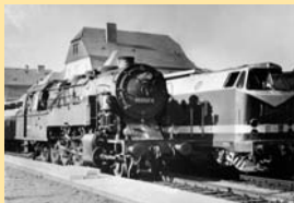
Dampf und Diesel in Sonneberg: 950041 und 119 014 am 21. Februar 1980

1885/1886 wurde die Zweigbahn durch das Steinachtal bis Lauscha (19 km) verlängert. 1900 nach Neuhaus b. Sonneberg und 1901 nach Stockheim/Ofr. zur Magistrale Berlin – München. Die „Tettaubahn“ fuhr ab 1903 über das meiningsche Dorf Heinersdorf. Das Hinterland erhielt Eisenbahnanschluss 1909 von Eisfeld nach Effelder, 1910 durchgehend bis Sonneberg. Die Rennsteigbahn Lauscha – Neuhaus am Rennweg – Bock-Wallendorf (ab 1952 Lichte-Ost) ist 1913 ihrer Bestimmung übergeben worden. Im Jahre 1920 konnten nach Fertigstellung des Schienenstranges über Heubisch – Muppberg 81,6 km Schienenwege im Landkreis nachgewiesen werden. Heute sind es 63,7 km.