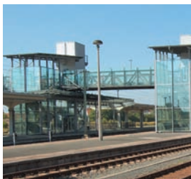
Fuß- und Radwegbrücke mit Aufzugstürmen

Am 20. Mai 1997 kam es zum ersten Spatenstich für den Umweltbahnhof. Mit dieser Komplexmaßnahme, einschließlich der Umgestaltung des Bahnhofsumfeldes, der Sanierung des Bahnhofsplatzes und dem Bau der Innenstadttangente ist der Öffentliche Personennahverkehr für die Stadt und die gesamte Region gestärkt und vernetzt worden. Unmittelbar neben dem