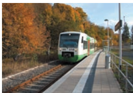
Regio-Shuttle bei der Ankunft in Sonneberg Nord

Diese Station ist die nördlichste im Stadtgebiet. Sie wird als Haltepunkt mit nur einem Gleis betrieben. Früher bildeten Empfangsgebäude und Güterschuppen eine Einheit. Der neue Bahnsteig wurde 2003 gebaut und das nicht mehr genutzte Empfangsgebäude Ende 2004 abgerissen.