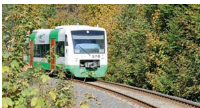
Auf dem Weg nach Sonneberg (Thür) Hbf: RS 1 der STB