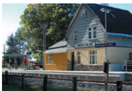
Haltepunkt Sonneberg West

Der Haltepunkt liegt idyllisch am Waldrand des „Eichberges“ – ideal für Wanderer und Naturfreunde. Fahrkarten wurden bis 1967 verkauft. Der Bahnsteig wurde 2002 erneuert.