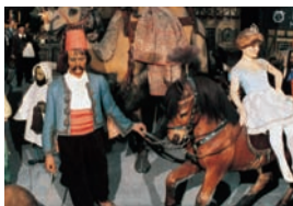
Im Deutschen Spielzeugmuseum: Thüringer Kirmes von 1910

Die Spielzeugstadt Sonneberg liegt am Südhang des Thüringer Waldes, direkt an der Landesgrenze zum Freistaat Bayern. Hier finden Besucher manche Sehenswürdigkeiten, Kultur- und Freizeitangebote, aber auch die Ruhe und Beschaulichkeit, die zu einem gelungenen Urlaub gehören.