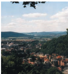
Blick vom Stadtberg