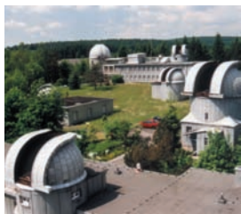
Sternwarte in Neufang