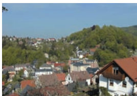
Blick in die Altstadt