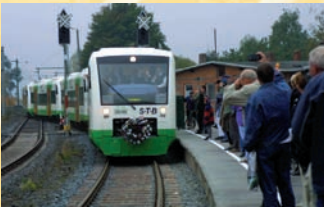
Ankunft des Eröffnungszuges am 3. Oktober 2002 auf dem Sonneberger Hauptbahnhof

Am 18. Dezember 1997 wurde vom Landkreis und dem Freistaat Thüringen die Vereinbarung über Gestaltung des SPNV zur Wiederinbetriebnahme der Relation Eisfeld – Sonneberg – Probstzella einschließlich der Stichbahn Ernstthal – Neuhaus am Rennweg unterzeichnet. Nach Instandsetzung konnte die „Steinachtalbahn“ Sonneberg – Lauscha am 26. September 1998 für den Reiseverkehr freigegeben werden, der am 2. Oktober 1999 wieder endete, der Sonneberger Bahnhof war Endstation wie 1858. Dezember 1999 : Es kam zur Bildung der Thüringer Eisenbahn GmbH (ThE). Die ThE hat nach 2001 das gesamte Sonneberger Netz für 17 Jahre von der DB Netz AG auf Pachtbasis übernommen. Das Land Thüringen übergab 2001 der ThE 24 Mio. DM (12,271 Millionen Euro) Fördermittel, den betreffenden Bewilligungsbescheid und die Genehmigung zum Betreiben der Infrastruktur. Die Sanierung begann am 4. September 2001 . Auf allen Stationen sind die Zuwegungen und Bahnsteige fahrgastfreundlich und behindertengerecht angelegt worden.